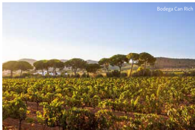
Bodega Can Rich

Das Weingut Can Rich liegt zwischen Sant Antoni und Buscatell. Es ist das grösste der Insel und stellt seit 1997 insoleigene Produkte mit dem Gütesiegel „Tierre de Ibiza“ her. Bei der Besichtigung erfahren Sie mehr über die Geschichte des Weinguts und die Herstellung der verschiedenen Weine sowie des bekannten Kräuterlikörs Hierbas Ibicencas. Im Anschluss erfolgt eine Weinprobe und Verkostung von ibizenkischen Spezialitäten.