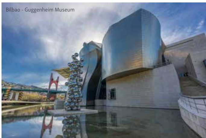
Bilbao - Guggenheim Museum

Ganztägiger Ausflug nach Bilbao mit erstem Halt am Aussichtspunkt Mirador de Artxanda, von wo sich aus 800 m Höhe ein ultimativer Blick über die Stadt bietet. Fahrt zur Biskaya-Brücke, die auch Puente de Portugalete genannt wird. Es handelt sich allerdings nicht um eine Hängebrücke im technischen Sinne, sondern um eine Schwebefähre, eine Hochbrücke mit daran befestigter Hängebarke. Die Fähre wurde 1893 eingeweiht und ist somit die älteste Schwebefähre der Welt, 2006 wurde das Bauwerk von der UNESCO zum Weltkulturerbe erklärt. Rundgang durch die Altstadt von Bilbao. Bilbao ist Architekturstadt, mit seinen originellen U-Bahn-Eingängen, die nach ihrem Designer Norman Foster „Fosteritos“ genannt wurden. Rundgang durch das Casco Viejo, die hübsche Altstadt Bilbaos. Zeit zur freien Verfügung und Mittagspause. Nachmittags Besuch des weltbekannten Guggenheim Museums mit seiner einzigartigen Architektur. Lassen Sie sich auf einer Ausstellungsfläche von 11.000 m 2 von den Kunstwerken der Dauerausstellung sowie den wechselnden Wanderausstellungen begeistern. Rückfahrt ins Hotel am späteren Nachmittag und Abendessen im Hotel.