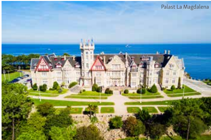
Palast La Magdalena

Geniessen Sie heute einen freien Tag. Spazieren Sie nochmals über die nahegelegene Halbinsel Magdalena mit dem wunderschönen Schloss oder genießen Sie den Tag an einem der schönen Strände rundum die Bucht El Sardinero mit typischen Strandbars „Chiringuitos“ und schönen Bademöglichkeiten. Individuelles Abendessen - entdecken Sie die tollen Tapas-Restaurants im Zentrum oder eines der Gourmet-Restaurants im Stadtteil El Sardinero.